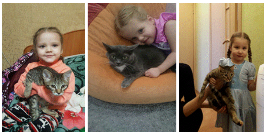
Волонтерство «Место под солнцем». Оказание помощи приюту бездомных животных «Дружок»